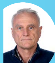
CAPOGRUPPO Ugo CORNARO PARTITO DEMOCRATICO