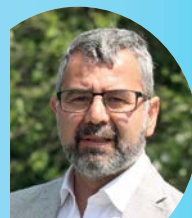
CAPOGRUPPO Giuseppe DI FILIPPO FRATELLI D'ITALIA