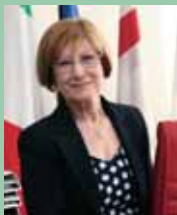
A cura di Silvana Santisi Saita