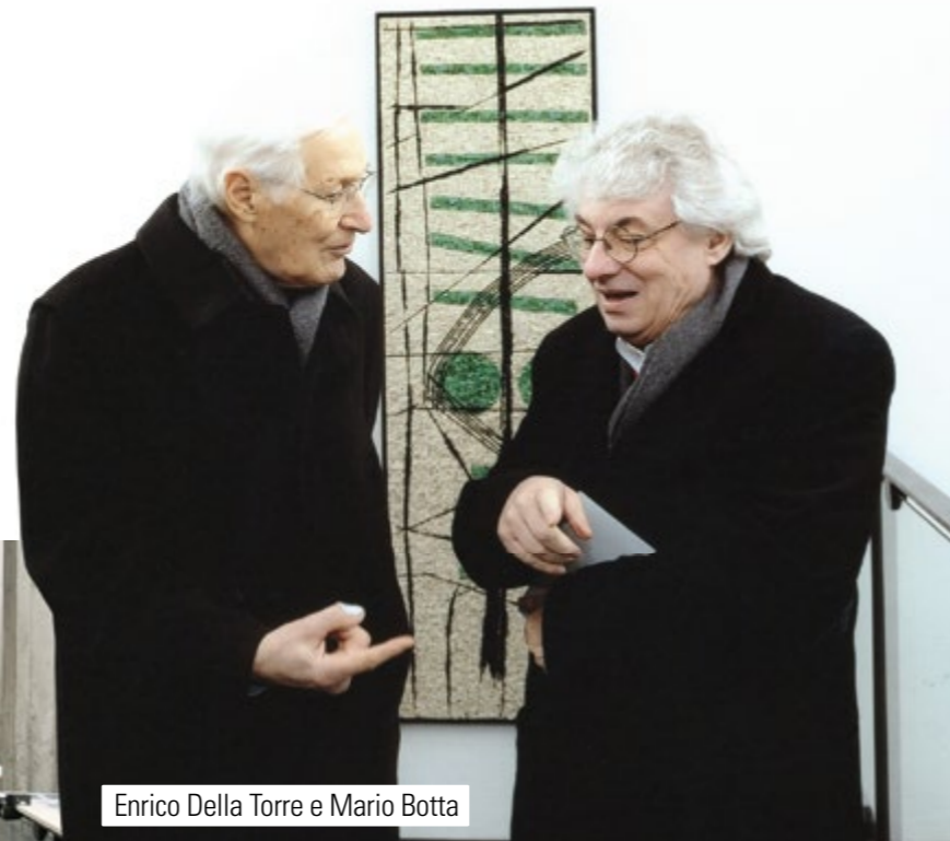
Enrico Della Torre e Mario Botta